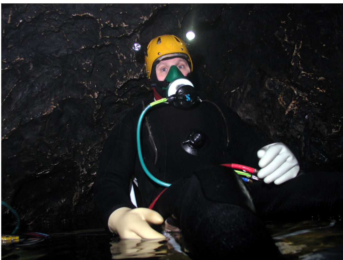
Décompression dans la cloche de -12m

En réalité j'ai respiré de l'oxygène avec 5 minutes de pause à l'air toutes les 25 minutes.